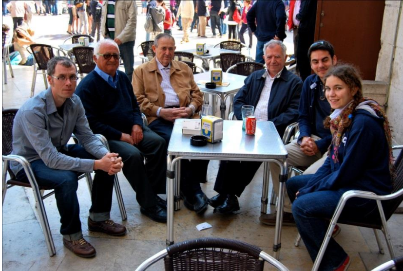
Texto: Juan Miguel Martínez Mortes

La “ sèquia de Benàger ” discurre en sus más de 4 km de longitud por los municipios de Quart de Poblet, Aldaia y por Alaquàs. A lo largo y ancho de su recorrido, esta sèquia nutre a más de 3000 anegadas entre las partidas dels Dimarts i dels Divendres; del Rollet, el Terç i la Cadireta.